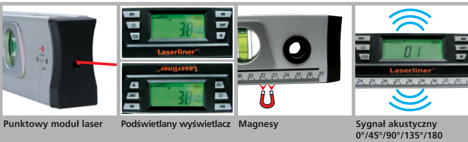
Punktowy moduł laser