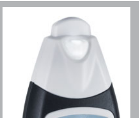
Wbudowane oświetlenie mierzonego miejsca