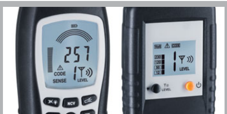
Przejrzysty, podświetlany wyświetlacz