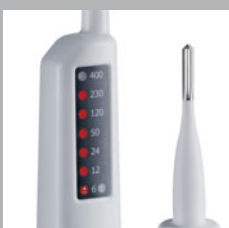
Wyświetlacz LCD o wysokim kontraście